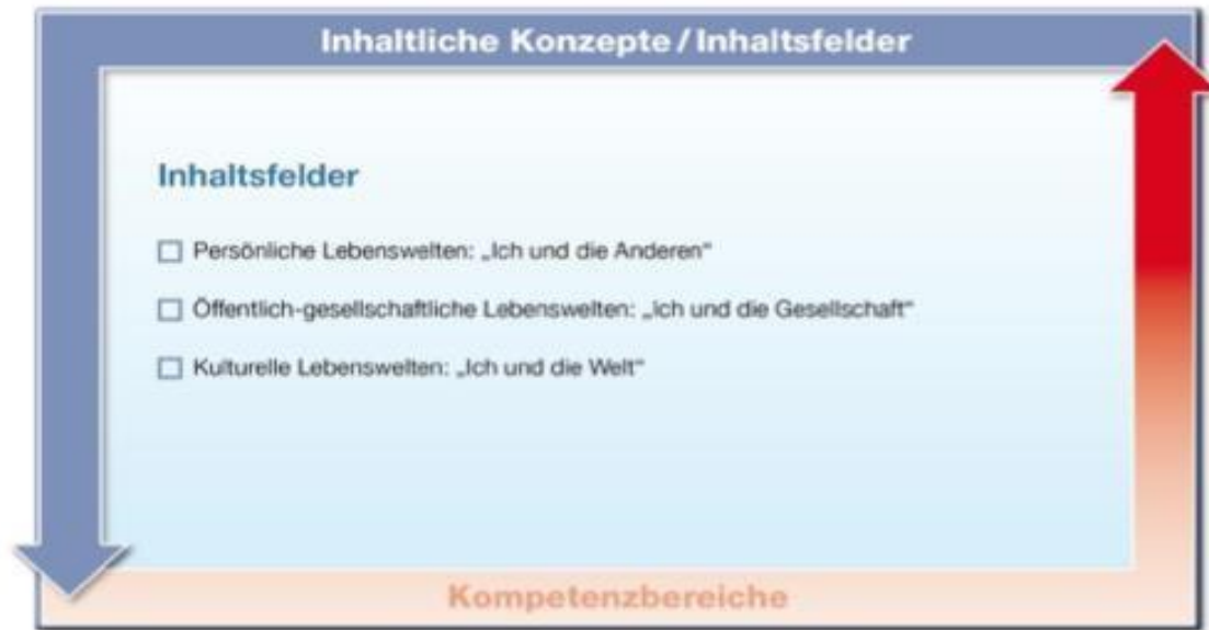
Abb. 2: Inhaltliche Konzepte / Inhaltsfelder

Im Fremdsprachenunterricht stehen die Identität der Lernenden und deren kommunikative Auseinandersetzung mit der Welt im Mittelpunkt. Die persönliche Lebenswelt der Lernenden wird im Prozess des Fremdsprachenlernens erweitert. Daher erstrecken sich die Inhalte von der Sphäre des Individuums über die Gesellschaft bis hin zur globalisierten Welt.