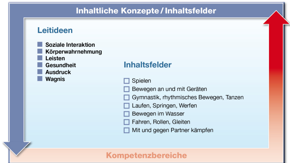
Abb. 2: Leitideen und Inhaltsfelder

Die Inhaltsfelder stehen in Bezug zu sechs Leitideen. Die Leitideen stellen fachliche Konzepte dar, die das gesamte Spektrum der Wissenselemente abdecken. Die Inhalte eines Faches sind durch Inhaltsfelder und Leitideen strukturiert. Die fachlichen Beziehungen werden durch den Konzeptgedanken über die Grundschule hinaus für die gesamte Lernzeit als roter Faden deutlich. Die Leitideen sind im Kerncurriculum für das Fach Sport der Sekundarstufe I detailliert erläutert.